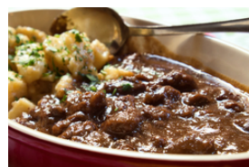
Wildfleisch mit dunklen Saucen, auch gegrillt oder gebraten