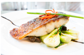
Gebratener oder gegrillter Fisch