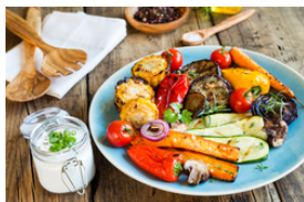
Idealer Begleiter für verschiedene Gemüse